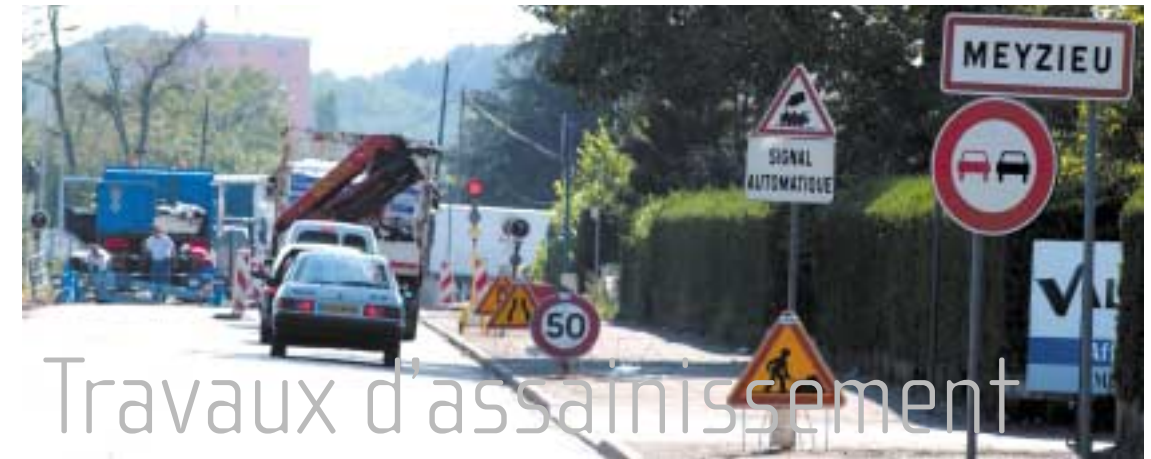
Démarrage des travaux juillet 2004 par les rues Schweitzer et Lionel Terray.