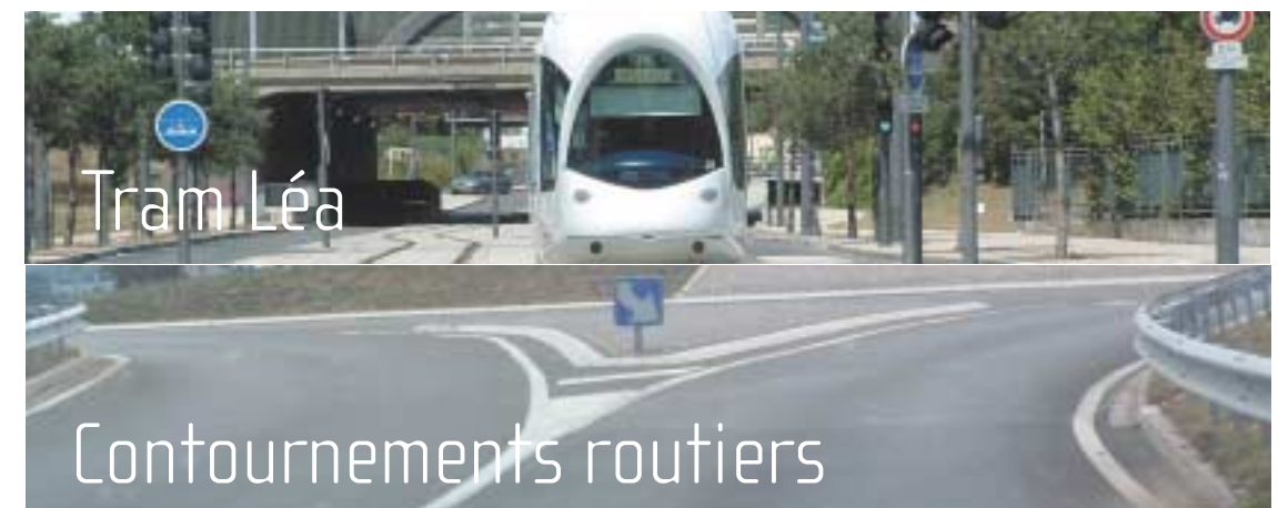
Projet Sytral, objectif mise en service fin 2006.