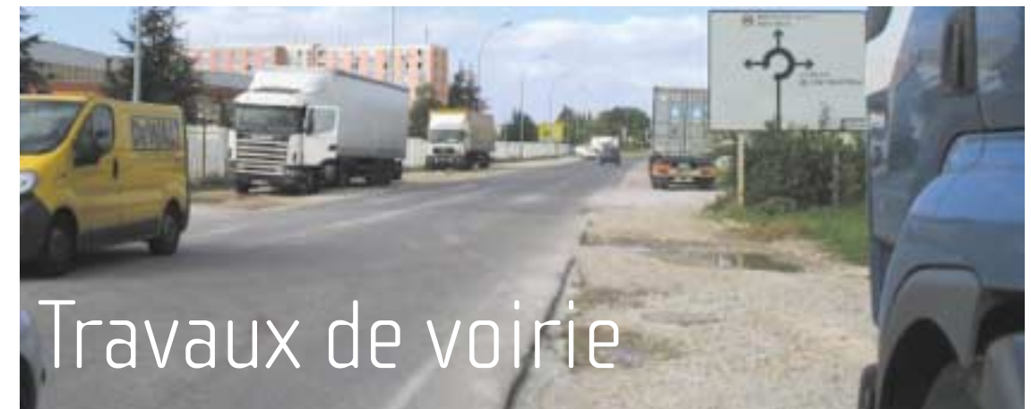
Démarrage des travaux novembre 2004 par la rue de la République.